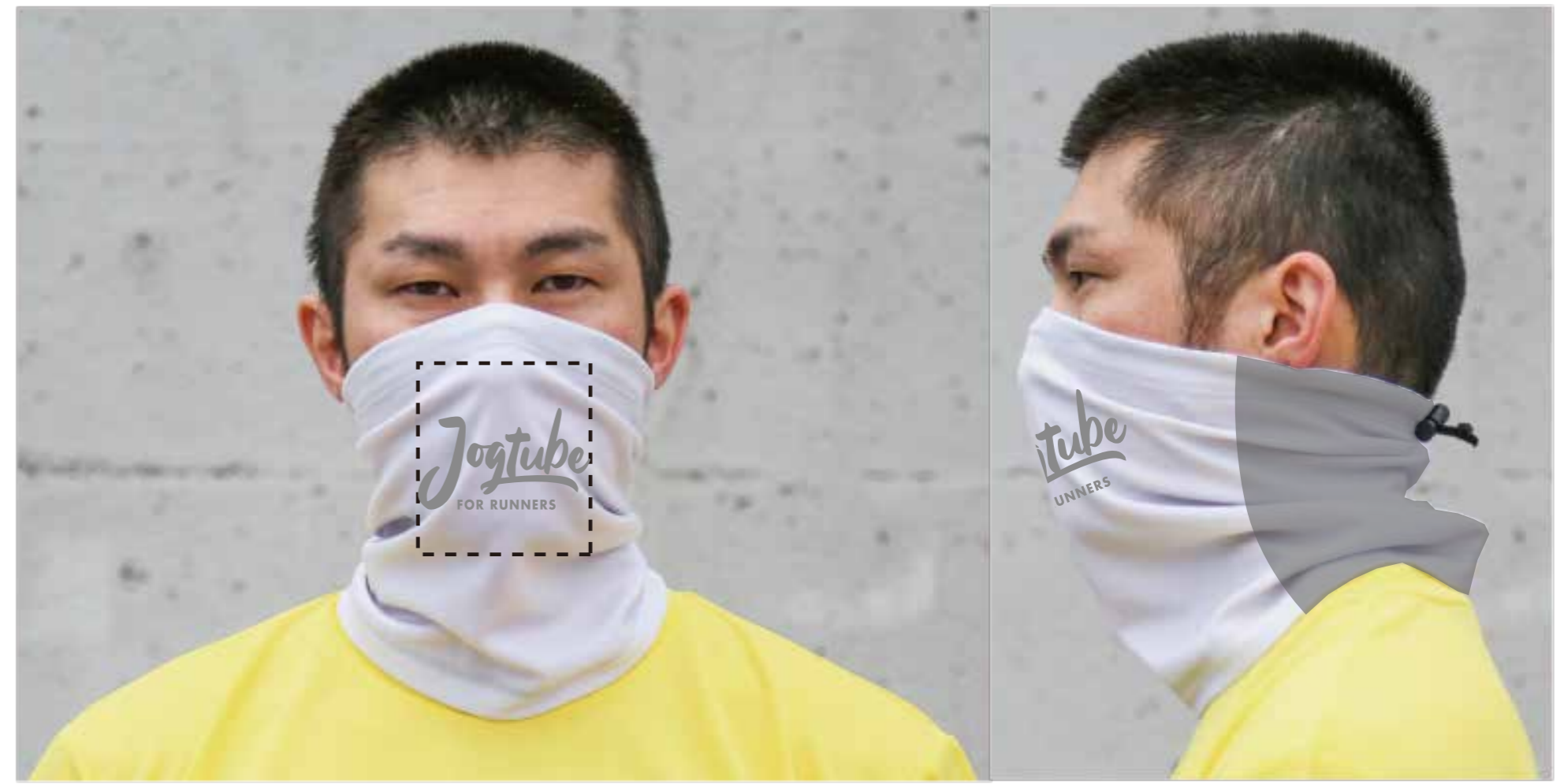
着用時のイメージ